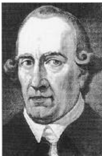
Jürgen-Christian Findorff (Moorkolonisator von 1720 - 1792)

An unserer Schule arbeiten 12 LehrerInnen, drei pädagogische Mitarbeiterinnen und ein Kollege der Pestalozzische, Förderschule Lernen. Neben acht Jahrgangsklassen mit ca. 150 Schülern gibt es eine zentrale Vorklasse (Schulkindergarten) sowie eine Kooperationsklasse des Förderzentrums „Schule am Klosterplatz, Schwerpunkt geistige Entwicklung“. Auch unser Schulkindergarten kooperiert in diesem Schuljahr mit Kindern der Schule am Klosterplatz.